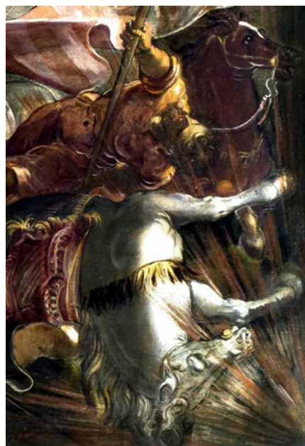
J. Tintoretto, La cattura di San Rocco (part.)