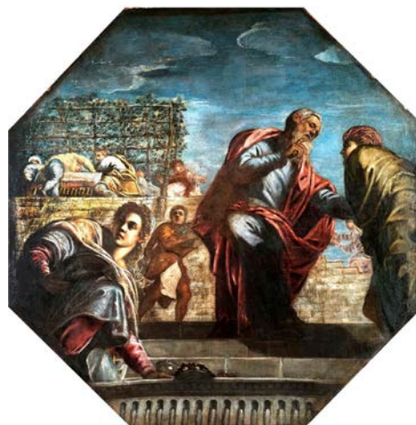
J. Tintoretto, Il ritorno del figliol prodigo