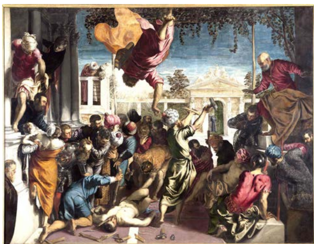
J. Tintoretto, San Marco libera uno schiavo

Alla luce di tutto ciò si ritiene opportuna una generale riflessione e un confronto approfondito che le Giornate di studio, a cura di Amalia Donatella Basso, intendono promuovere.